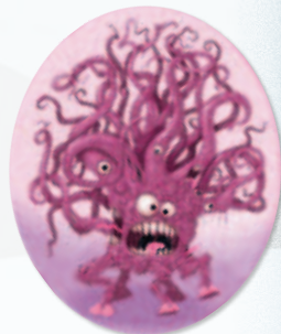
Rejeton de Shub-Niggurath