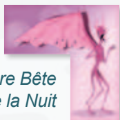
Maigre Bête de la Nuit

Ces jetons représentent les créatures à attraper pendant la partie. Il existe 6 types de Créatures, chacun présent en 5 couleurs.