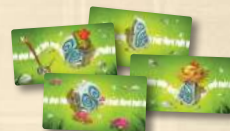
9 tuiles Borne