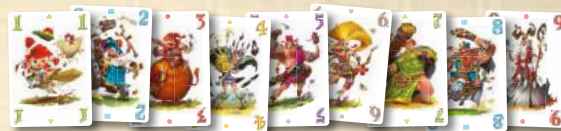
54 cartes Clan numérotées de 1 à 9 (en 6 couleurs)