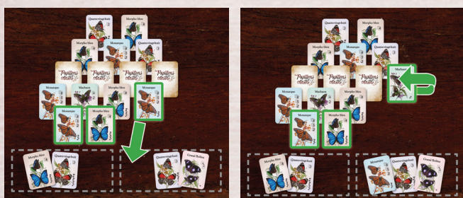
La joueuse 2 collecte un Monarque