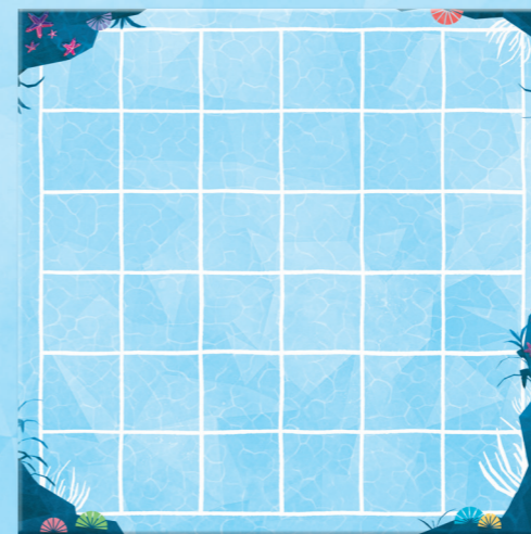
1 plateau Récif