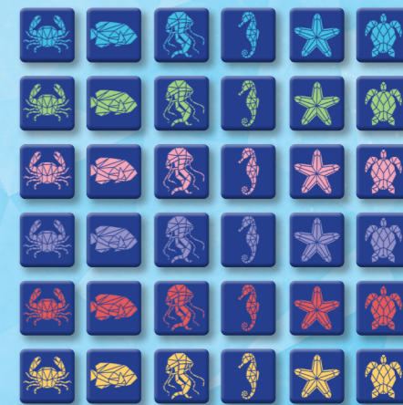
36 tuiles Créature marine