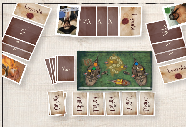
Exemple de mise en place pour 3 pirates.